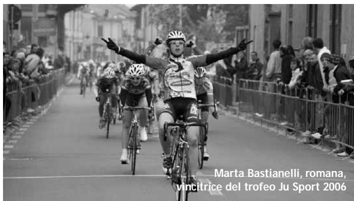
Marta Bastianelli, romana, vincitrice del trofeo Ju Sport 2006